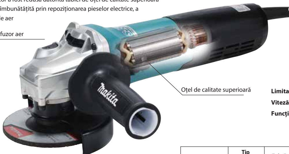
Oțel de calitate superioară