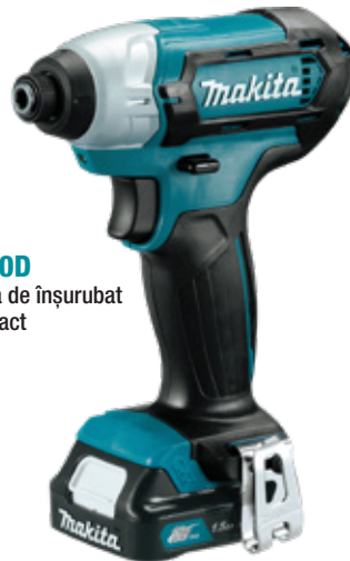
TD110D Mașină de înșurubat cu impact