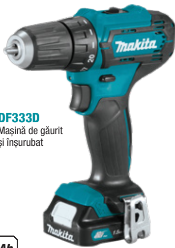
DF333DZ Mașină de găurit și înșurubat